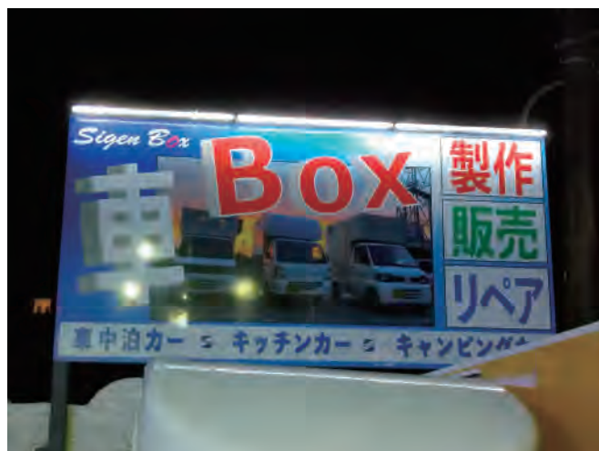
幅約 3600× 高さ約 1800